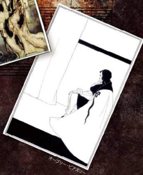
オーブリー・ビアスリー

若き日から死の前年まで夢みた幻のオペラが 迫真のテキストを活かす試補筆版で蘇る 交響詩「海」の6手2台版も必聴!