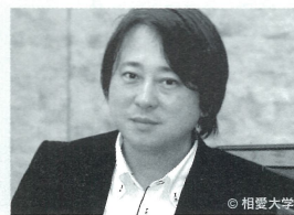
プリバード・ピアノ 稲垣 聡 Satoshi Inagaki

1987年ガウデアムス国際現代音楽コンクールで初のアコーディオン奏者として優勝。99年ドイツ音楽協会クラシック部門で最優秀演奏家。42枚のCDをリリースし、受賞多数。