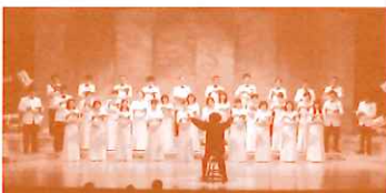
東京混声合唱団 The Philharmonic Chorus of Tokyo

名古屋生まれ。東京大学工学部卒業後音楽の道へ進み、東京芸術大学作曲科卒業。同大学院修了。1977年ジュネーブ国際バレエ音楽作曲コンクールにて史上二人目のグランプリ並びにジュネーブ市賞を受賞。84年度文化庁芸術祭優秀賞受賞。IMCに入選。2000年第18回中島健蔵音楽賞受賞。04年「風神・雷神」のCDが文化庁芸術祭大賞を受賞。05年万博記念オペラ「白鳥」が名古屋において世界初演され、この公演に佐川吉男音楽賞が授与される。06年オーケストラ・アンサンブル金沢のコンポーザー・イン・レジデンスに就任し、「協奏的交響曲〜エランヴィタール〜」を世界初演し、第55回尾高賞を受賞。現在、東京音楽大学客員教授。