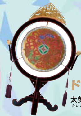
ドン 太鼓 たいこ