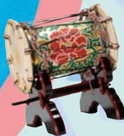
テンテン 鞆鼓 かっこ