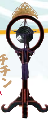
チチン 鉦鼓 しょうこ

休憩中に 子どものための 体験コーナー があります 数に限りがあります。 13:00に整理券配布