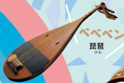
ベベベン 琵琶 ひわ