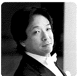
沼尻竜典・指揮 Ryusuke Numajiri, Conductor