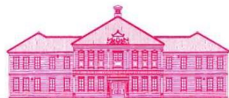
重要文化財 旧東京音楽学校奏楽堂

会 場 : 台東区立旧東京音楽学校奏楽堂 (台東区上野公園8-43) ※地図裏面