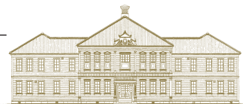
重要文化財 旧東京音楽学校奏楽堂