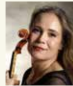
ヴァイオリン リーラ・ジョセフオウィッツ Leila Josefowicz, Violin