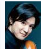
ヴァイオリン 成田達輝 Tatsuki Narita, Violin