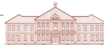
重要文化財 旧東京音楽学校奏楽堂